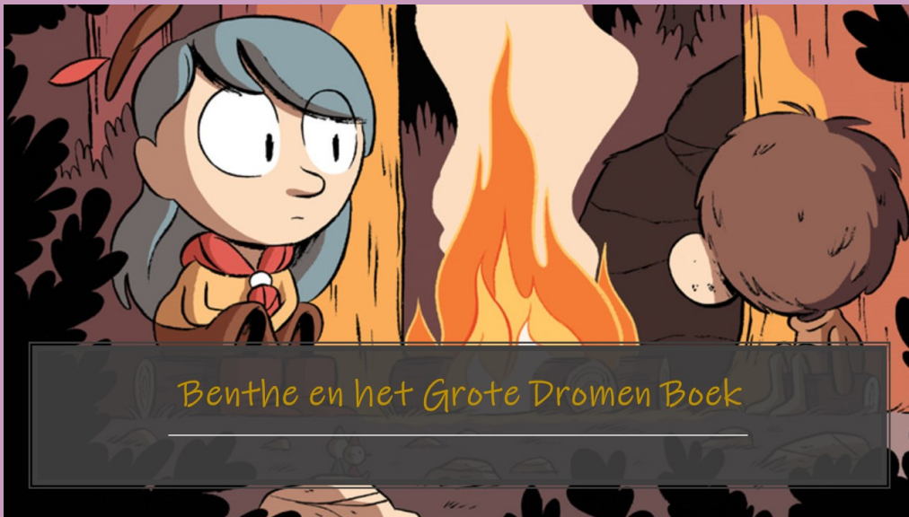
Benthe en het Grote Dromen Boek